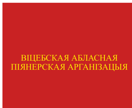
Знамя областной (Минской городской) пионерской организации (оборотная сторона)