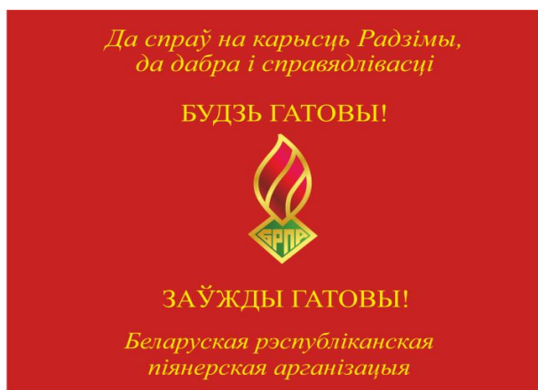
Знамя районной (городской) пионерской организации (лицевая сторона)