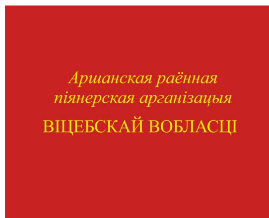
Знамя районной (городской) пионерской организации (оборотная сторона)