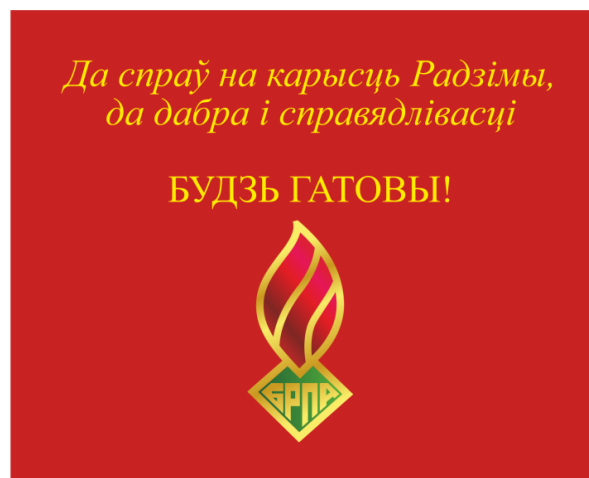
Знамя ОО «БРПО» (оборотная сторона)