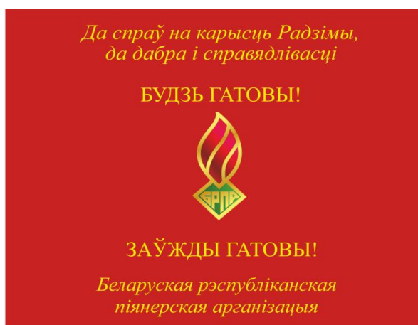
Знамя областной (Минской городской) пионерской организации (лицевая сторона)