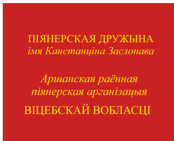
Знамя пионерской дружины (оборотная сторона)