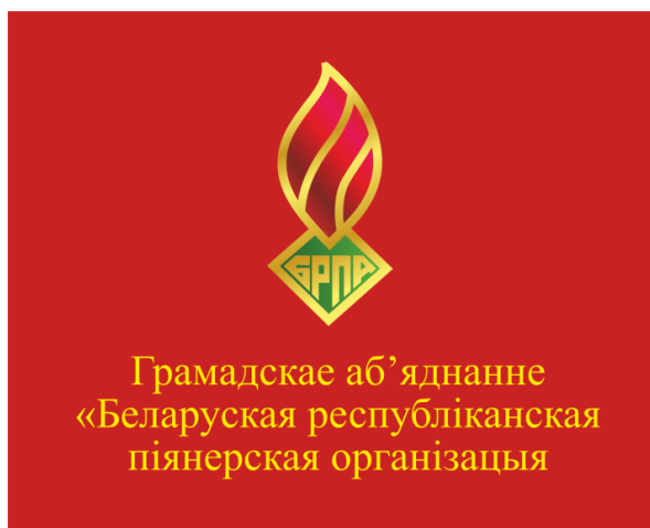
Знамя ОО «БРПО» (лицевая сторона)